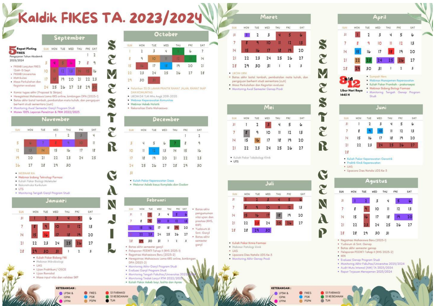
Gambar 2.1 Kalender Akademik FIKES UDS